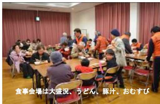
食事会場は大盛況、うどん、豚汁、おむすび

■鳥取県中部地震発生から3ヶ月が経過しました。1月23～24日には山陰特有の大寒波が襲来し、倉吉地域でも40cmの積雪となり、屋根瓦にブルーシートの家屋では二次災害の恐れもあります。今回の中部地域「新年のつどい」以後も医療生協らしい支援活動の取り組みと同時に、医療生協の健康づくり等を軸とした活動をすすめて行く予定です。