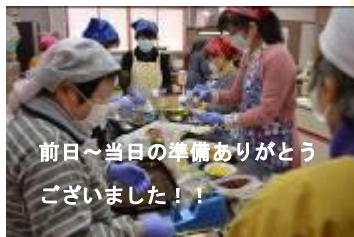
前日～当日の準備ありがとうございました！！