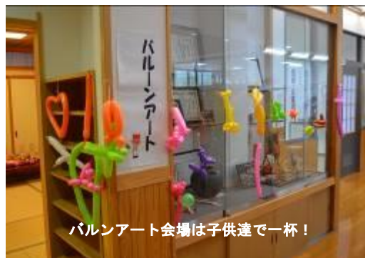
バルーンアート会場は子供達で一杯！