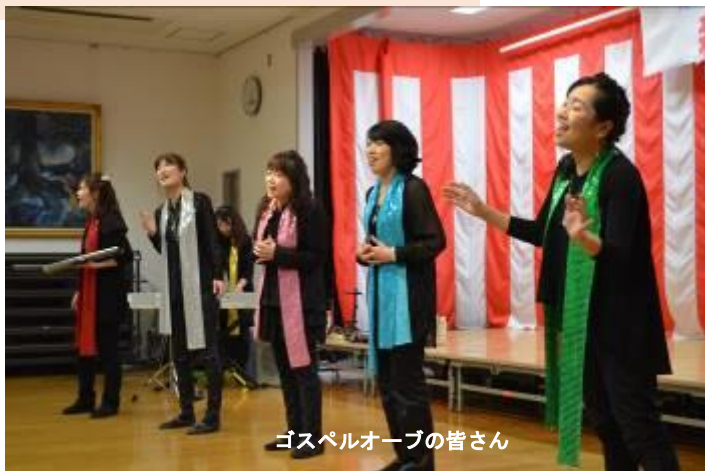
ゴスペルオーブの皆さん

■「ゴスペルオーブ」は米子市を中心に山陰各地で生歌～演奏をされているグループでメンバーは3人～40人、今回は6人の方に来ていただきました。会場内を回りながら生歌を披露していただき、参加者も一緒に手拍子されるなど活気溢れる時間を過ごすことができました。■6人の内1人は倉吉市出身、もう1名は米子医療生協の職員で身近な方でした。■華やかな歌声で40分間があつという間に過ぎた楽しい時間でした。