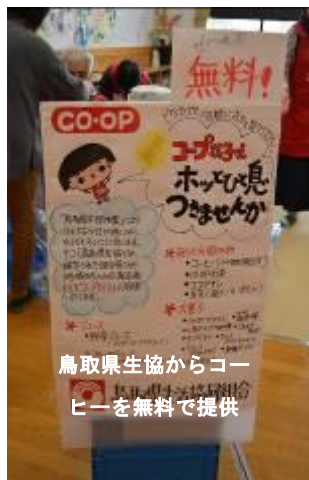
鳥取県生協からコーヒーを無料で提供