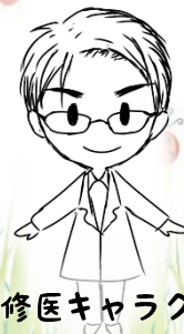
研修医キャラクター にしでくん